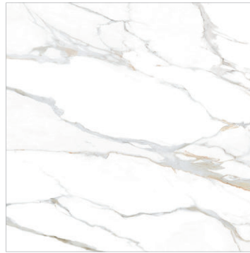
Aurora Gold 90x90 36"x36" POLISHED RECTIFIED - NATURAL RECTIFIED