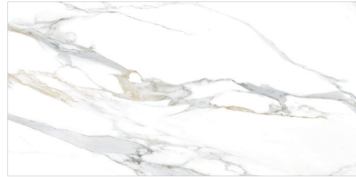
Aurora Gold 90x180 36"x72" POLISHED RECTIFIED - NATURAL RECTIFIED