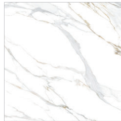
Aurora Gold 60x60 24"x24" POLISHED RECTIFIED NATURAL RECTIFIED