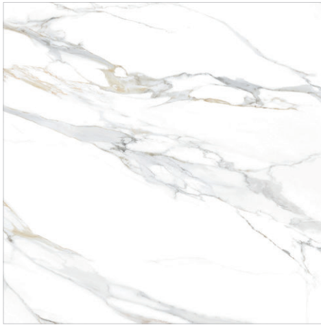
Aurora Gold 120x120 48"x48" POLISHED RECTIFIED - NATURAL RECTIFIED