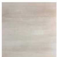
LIMESTONE LIGHT GREY 60X60 02P0608768 30X60 02P0608769