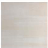
LIMESTONE MARFIL 60X60 02P0608764 30X60 02P0608765