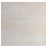
LIMESTONE MARFIL 60X60 02P0608764 30X60 02P0608765