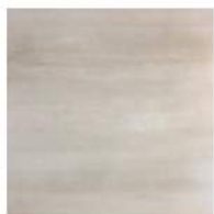
LIMESTONE LIGHT GREY 60X60 02P0608768 30X60 02P0608769