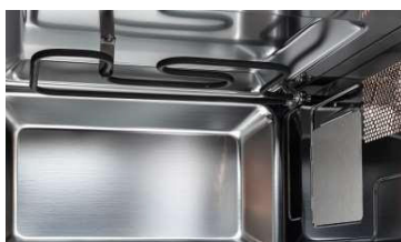
Grill de resistencia